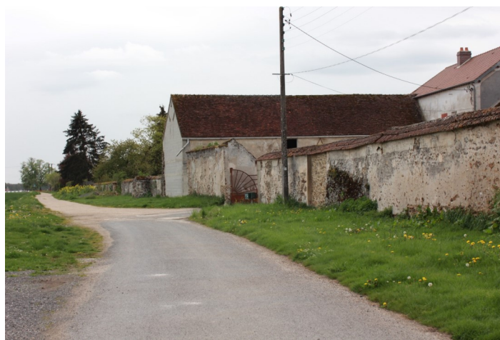
Ferme de la Villeneuve et la voie douce Photos : N. Lucas - Association "Regard en Coin" - 2023