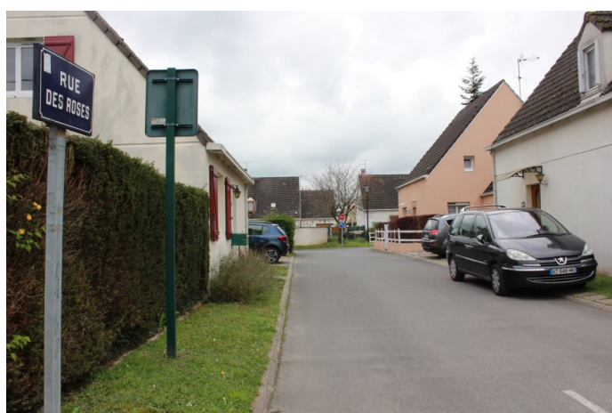
Rue des Roses (lotissement "La Villeneuve I")

Photos : N. Lucas Association "Regard en Coin" - 2023