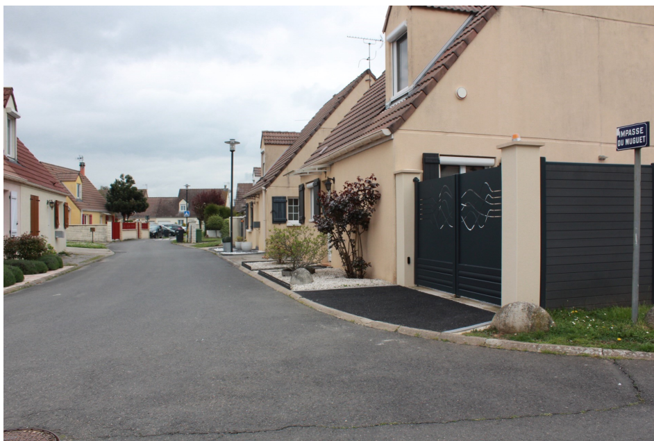
Impasse du Muguet (lotissement "La Villeneuve II")