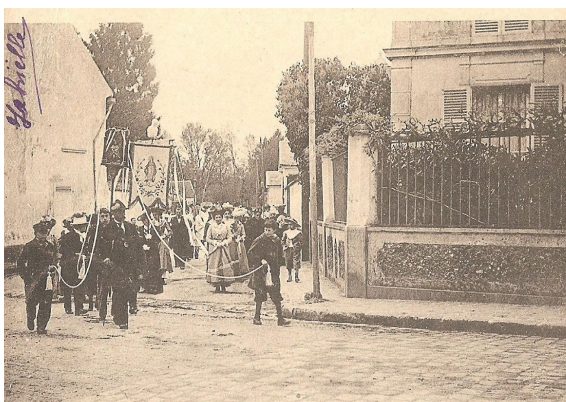
Procession Sainte-Fare , destinée à la commémoration de la 1 ère abbesse, fondatrice de la ville. Le départ se faisait de l'église Saint-Sulpice pour arriver à la Croix Sainte-Fare Carte postale ancienne - 1902