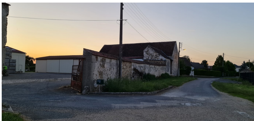
Ferme de la Villeneuve