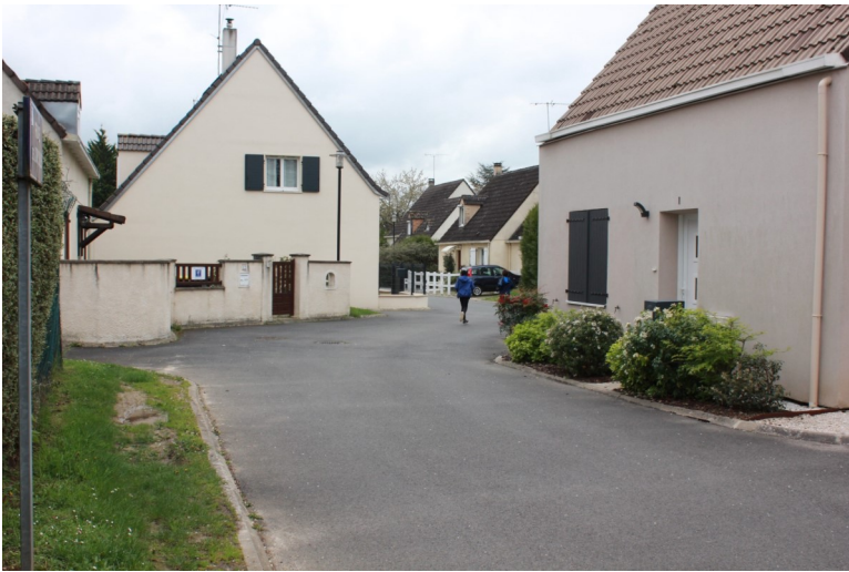
Rue des Jonquilles (lotissement "La Villeneuve I")