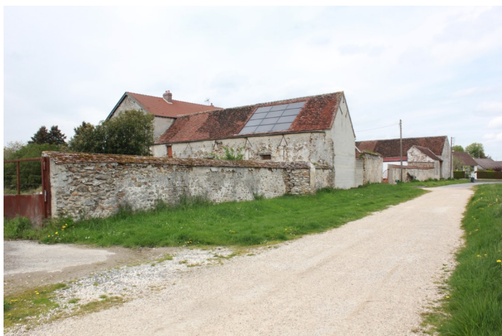
Ferme de la Villeneuve et la voie douce Photos : N. Lucas - Association "Regard en Coin" - 2023

A l'angle de cette voie et du boulevard Lambert du Mée, se trouve la ferme de la Villeneuve. Elle existe depuis plusieurs siècles et elle est toujours en exploitation.