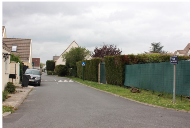
Rue des Violettes (lotissement "La Villeneuve I")