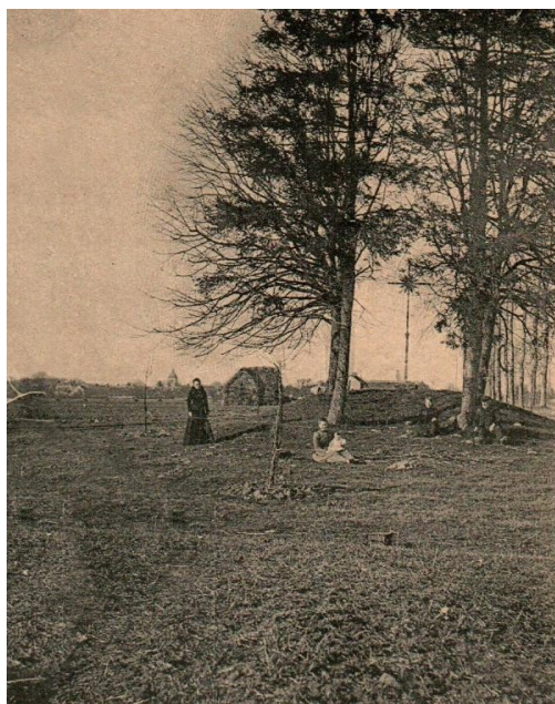
Croix Sainte-Fare entre les arbres Carte postale ancienne - début du XX ème siècle

Le rôle des croix était de matérialiser les limites entre les ressorts des dîmes, qui devinrent ensuite les limites communales (2) .