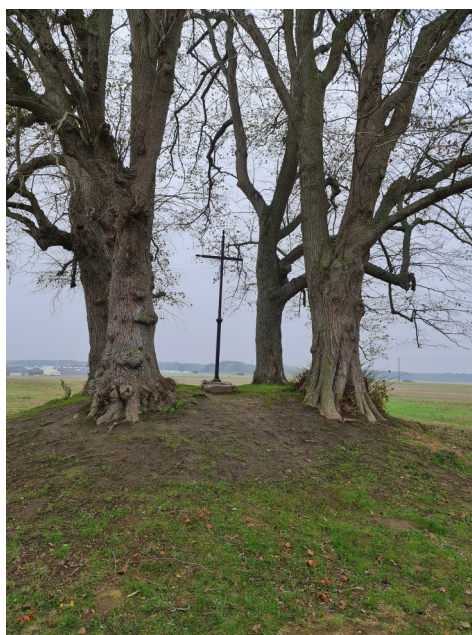
Croix Sainte-Fare entre les arbres, au même endroit Photo : I. Aubertin - 2019.