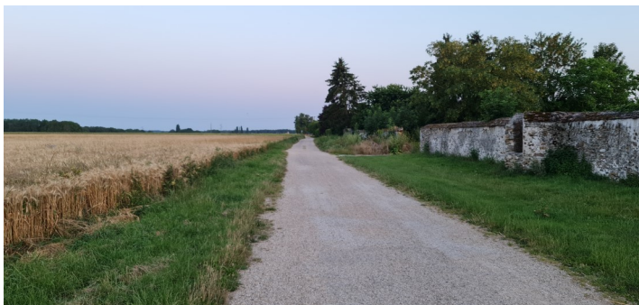
Voie douce - Photo : I. Aubertin - 2023

Ce chemin part du boulevard Lambert du Mée et aboutit au hameau des Bordes. Cette voie permet aux randonneurs, écoliers, vélos de se promener en toute quiétude.