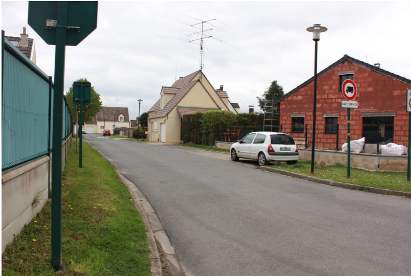
Rue des Primevères (lotissement "La Villeneuve II")