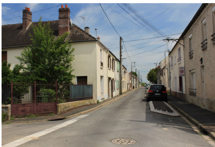
Au même endroit, au n°45 Photo : N. Lucas - Association "regard en Coin" - 2023