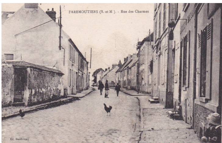
Rue des Charmes , à l'angle avec la rue de la garenne (en face du n°45) Carte postale ancienne - début du XX ème siècle