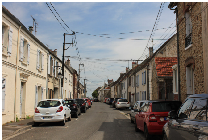
Au même endroit, au n°25 Photo : N. Lucas - Association "regard en Coin" - 2023