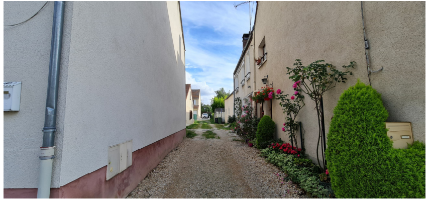
Cour au 33 rue des Charmes