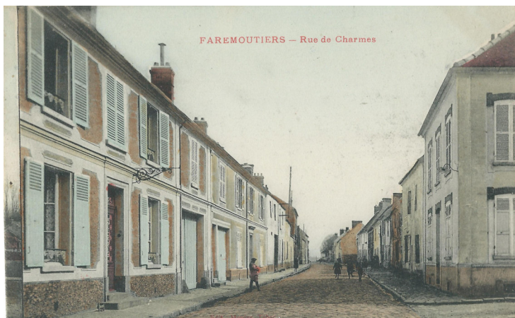
Rue des Charmes , à l'angle avec la ruelle Coursoupe (en face du n°6) Carte postale ancienne - début du XX ème siècle