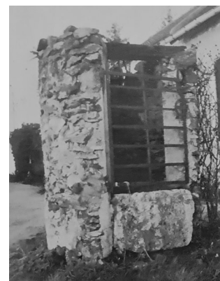
Puits disparu dans près de la descente du Poncet Début du XX ème siècle (1)