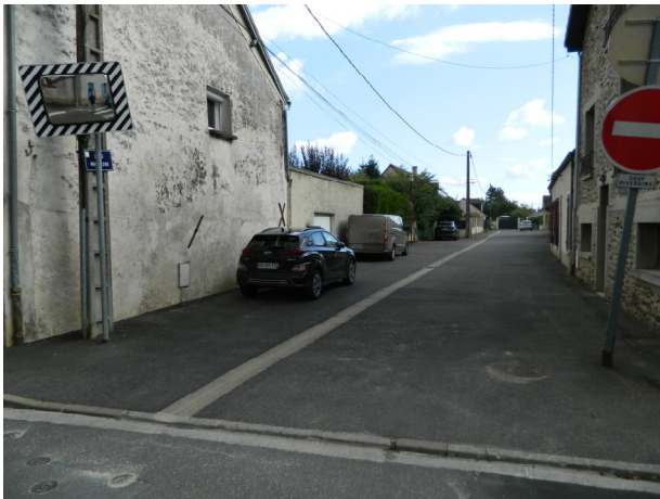
Ruelle Malvoisine (au 47 rue des Charmes)