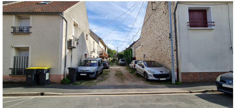
Ruelle de la Villeneuve