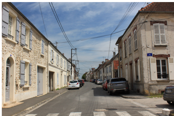
Au même endroit Rue des Charmes , à l'angle avec la ruelle de Coursoupe