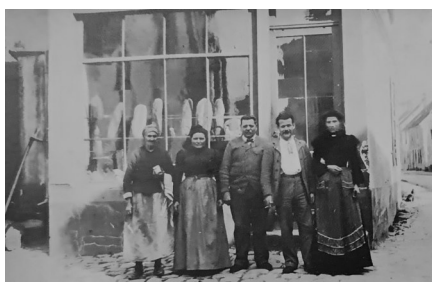
Boulangerie Vacher - 1912 (1)