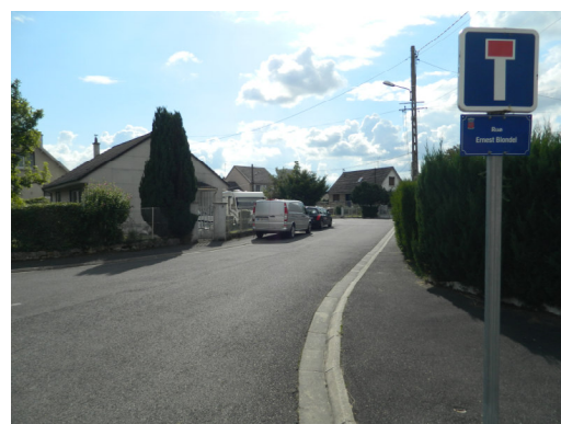
Rue Ernest Blondel