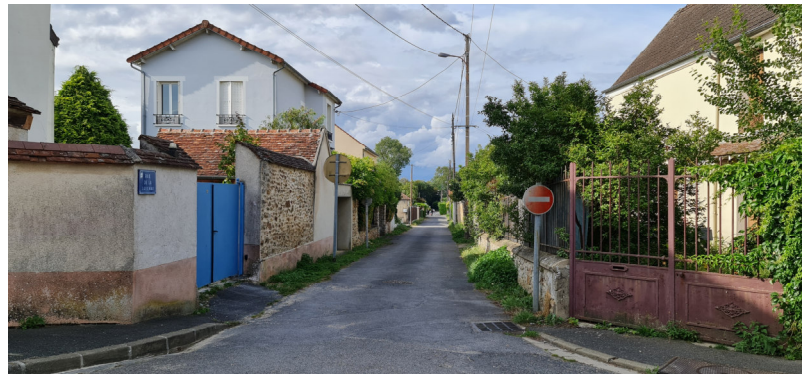
Rue de la Garenne