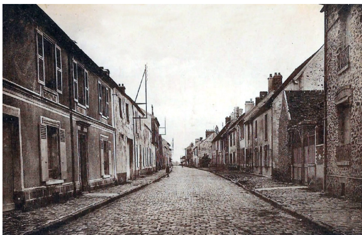
Rue des Charmes , au n°25 Carte postale ancienne - début du XX ème siècle