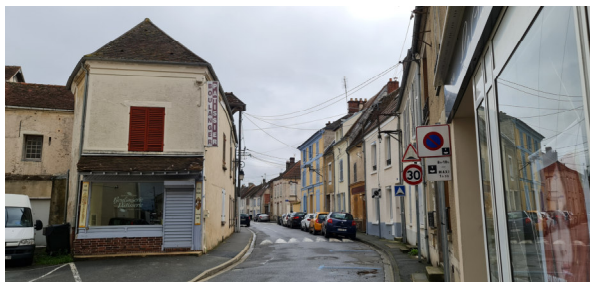
Au n°2 de la rue des Charmes - 2023