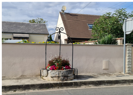
Puits situé au n°50 de la rue