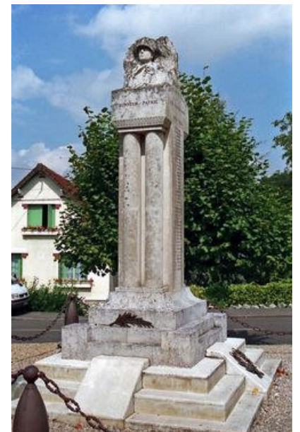
Monument aux morts de Saints

Nommé professeur à l'Ecole Nationale des Arts décoratifs en 1930, il est élu membre de l'Académie des Beaux-Arts en 1943, à l'Institut de France. Paul Niclausse sera plus tard promu Chevalier de l'Ordre National de la Légion d'Honneur.