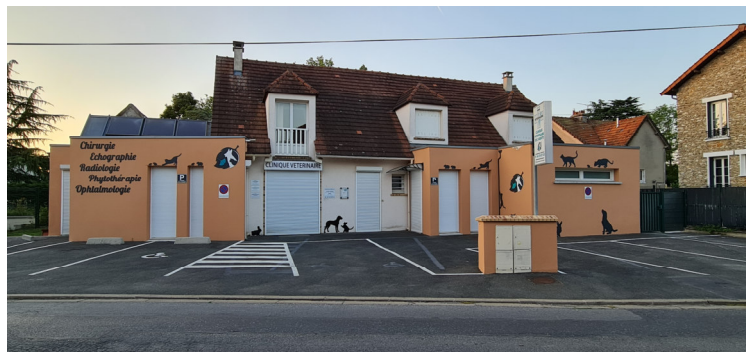
Boulevard Paul Niclausse : vétérinaire à l'extrémité du boulevard, en direction de la rue du Commandant Arnaud Photo : I. Aubertin - 2023