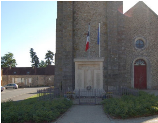
Monument aux morts de Pommeuse Photo : B. Dumont - 2021