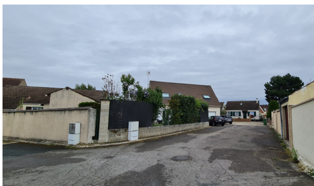
Résidence du Verger : milieu de la voie avec les 2 autres rues Photo : I. Aubertin - 2023