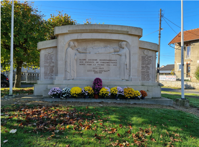
Monument aux morts de Faremoutiers Photo : I. Aubertin - 2020

Pour les monuments de Saint-Augustin et Faremoutiers, il fait poser des habitants des communes comme Marceau Massoul, représentant le poilu sur les deux monuments.