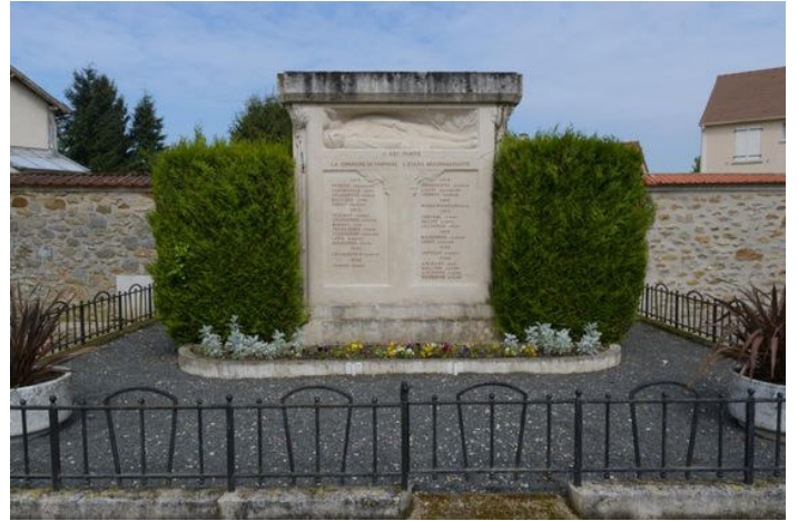
Monument aux morts de Verneuil l'Etang Photo : B. Dumont - 2021