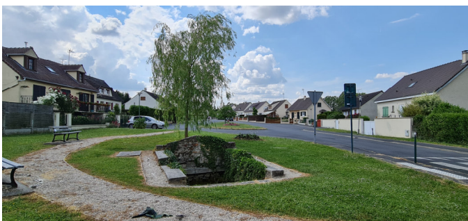
Rue de la source : source située sur la placette au centre de la rue Photo : I. Aubertin - 2023