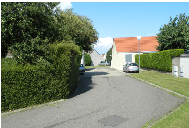
Résidence du Verger vue depuis le boulevard Paul Niclausse Photo : B. Chigot - Association "Regard en Coin" - 2023