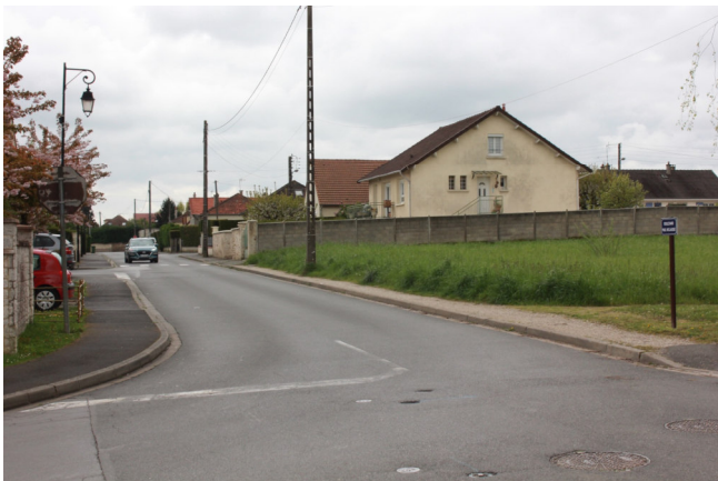
Boulevard Paul Niclausse , vue en direction de la rue de Paris