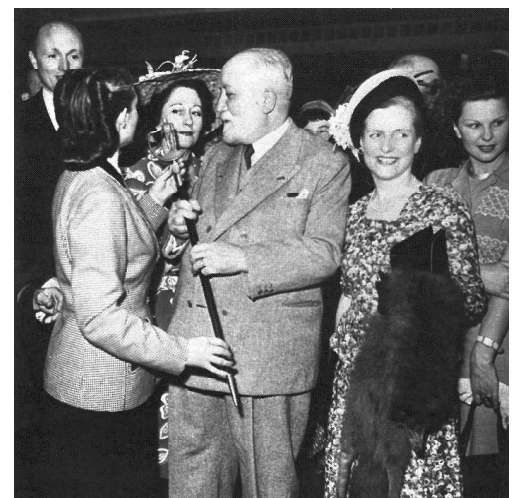
Paul Niclausse recevant son épée d'académicien en 1943

Il repose depuis dans le petit cimetière de Saint-Augustin, en cette terre de Brie qui fut pour lui une terre d'adoption.