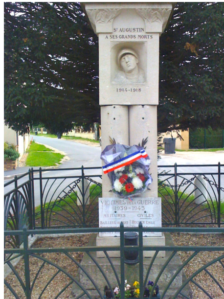
Monument aux morts de Saint-Augustin Photo : B. Dumont - 2021