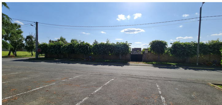
Rue de la source : entrée du cimetière