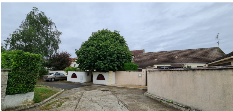
Résidence du Verger : extrémité de la voie