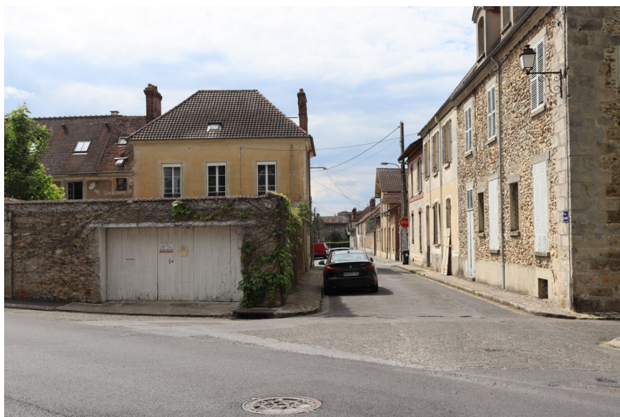
Rue Da Costa - Photo : B. Chigot - Association "Regard en Coin" - 2023