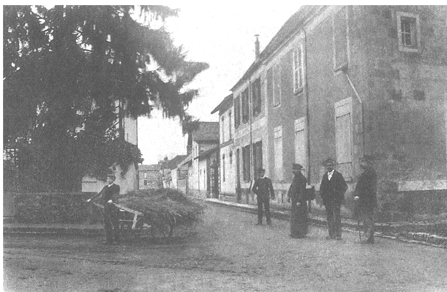
Carte postale ancienne rue Labron—Ancien nom de la rue Da Costa - fin du XIX ème siècle Retouchée par M. de Boissy La maison au premier plan à droite était le bureau de poste