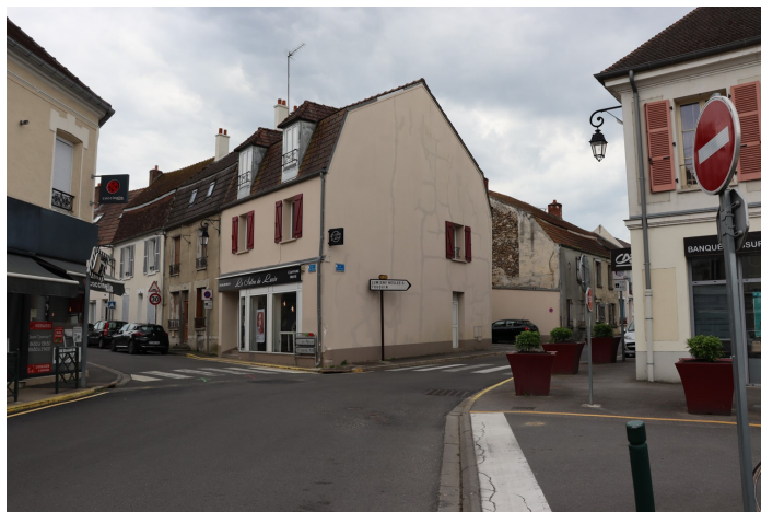
Rue du 27 Août (ex-rue Durfort), au même endroit