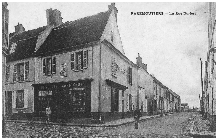
Rue Durfort (1) , vue sur la pâtisserie - confiserie "Gullu" Photo : Carte postale ancienne - début du XX ème siècle