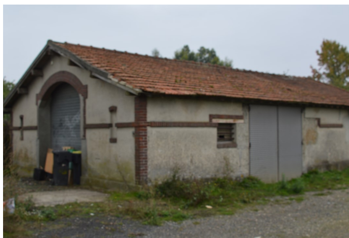
Lavoir boulevard Lambert du Mée Photo : B. Dumont - 2019

Le lavoir, actuellement désaffecté, fut construit en même temps que le château d'eau en 1911. Il était entièrement couvert et constitué de deux bassins alimentés par l'eau du puits.