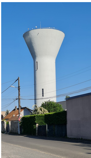
Château d'eau Photo : I. Aubertin - 2023

A la fin du XIX ème siècle, la commune de Faremoutiers a entamé de multiples démarches pour alimenter la ville en eau. Grâce à un don de 5 000 Francs-Or de Louis Fénelon Desfourneaux, pour la réalisation d'un réseau de distribution d'eau dans le village, la commune décide en février 1901 de forer un puits.