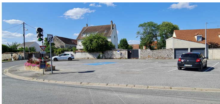
Place des fêtes vue du boulevard Lambert du Mée Photo : I. Aubertin - 2023