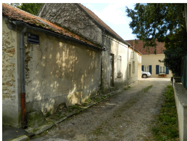
Ruelle Bécoiseau