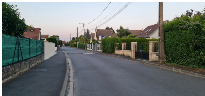
Boulevard Lambert du Mée Photo : I. Aubertin - 2023