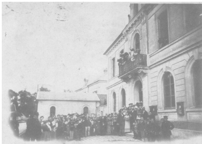
Election de la Rosière—Hôtel de Ville - Carte postale ancienne

Il est marchand à Coulommiers. Le 8 avril 1649, il achète le fief et seigneurie du Mée sur la paroisse de Saints par un acte d'échange. Il devient Seigneur du Mée.