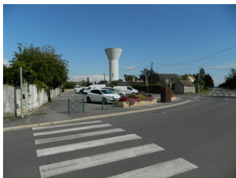
Place des fêtes vue de la rue du 27 août