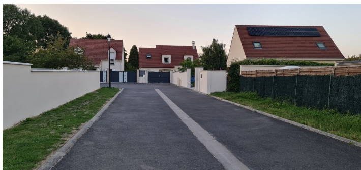
Clos des Lauriers, ensemble pavillonnaire situé dans le boulevard Lambert du Mée Photo : I. Aubertin - 2023