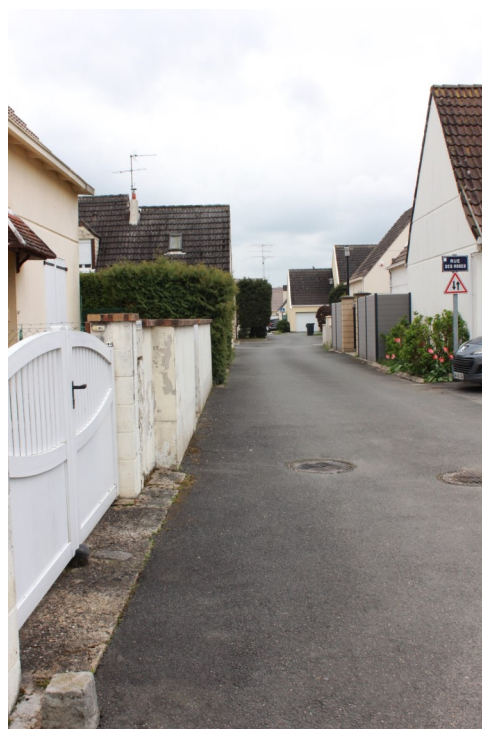
Rue des Roses Photo : N. Lucas - 2023 - Association "Regard en Coin"