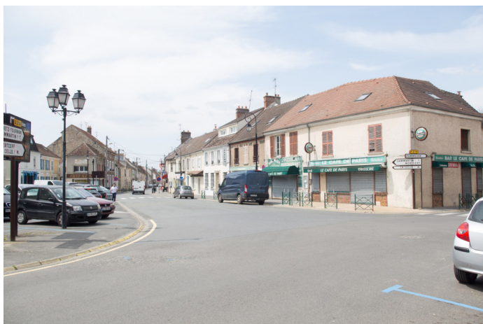
Place du général de Gaulle vue depuis la rue des Charmes. Au 1 er plan : le Café de Paris.

Photo 1 : carte postale ancienne - début XX ème siècle