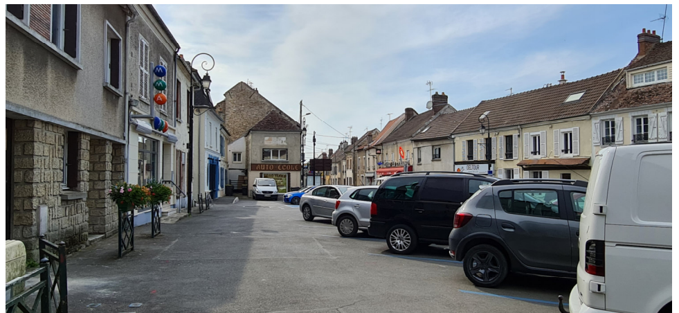
Vue sur place du général de Gaulle vers la rue des Ormes Photo : I. Aubertin - 2023