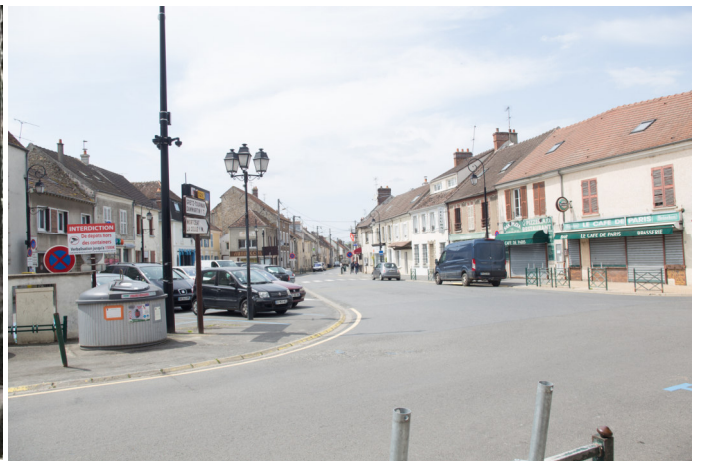
Carrefour entre la rue des Moutiers et la place du général de Gaulle Photo : carte postale ancienne - Années 1960 Photo : B. Chigot - 2023 - Association "Regard en Coin"