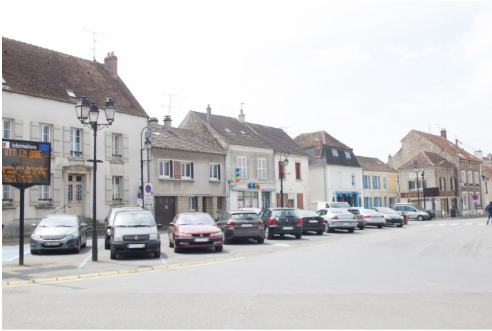
Vue sur place du général de Gaulle Photo : B. Chigot - Association "Regard en Coin" - 2023