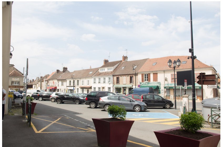
Vue sur place du général de Gaulle vers la rue des Ormes