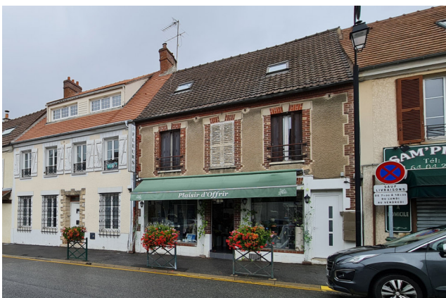
Au n°2 de la place