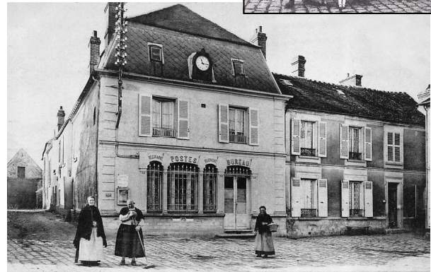
Au même endroit, Hôtel des Postes Cartes postale ancienne vers 1910