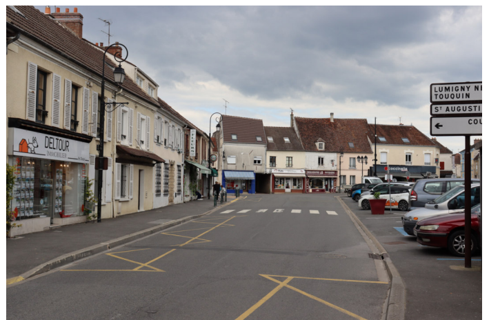
Place du général de Gaulle vue depuis la rue des Ormes. Au 1 er plan : la maison de la presse devenue l'agence immobilière "Deltour". Photo : carte postale ancienne - Années 1960 Photo : B. Chigot - 2023 - Association "Regard en Coin"