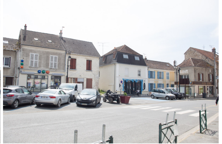
Vue sur place du général de Gaulle