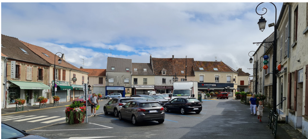
Place de Gaulle vue vers la rue des Moutiers Photo : I. Aubertin - 2023