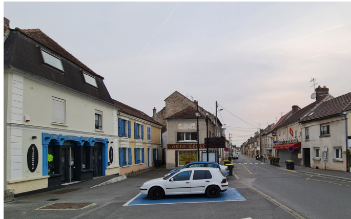
Place du général de Gaulle vers la rue des Ormes. Au 1 er plan : l'auto-école S. Baudier.

Photos 1-2-3 : cartes postales anciennes - début et milieu du XX ème siècle