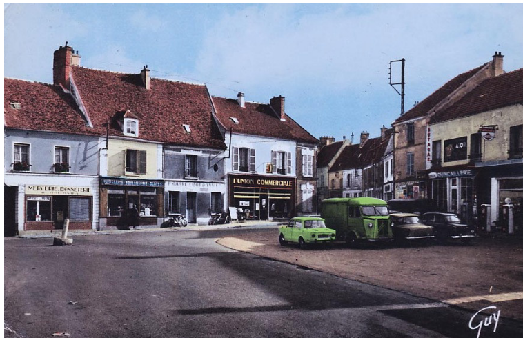
Place du marché vue vers la rue des Moutiers Image 1 : Carte postale ancienne - début du XX ème siècle Image 1 : Carte postale ancienne - années 1940-1950 Image 3 : Carte postale ancienne - 1954