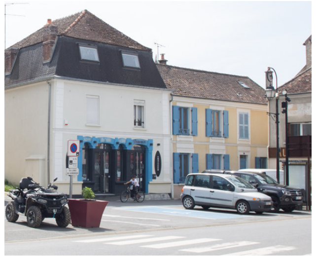
Place du général de Gaulle vue depuis la rue des Moutiers. Au 1 er plan : le bureau de poste devenu la poissonnerie "Phare Moutier Marée". Photo : carte postale ancienne - début XX ème siècle Photo : B. Chigot - 2023 - Association "Regard en Coin"