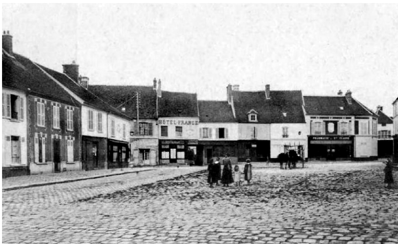
Place du marché vue vers la rue des Moutiers Carte postale ancienne - 1904