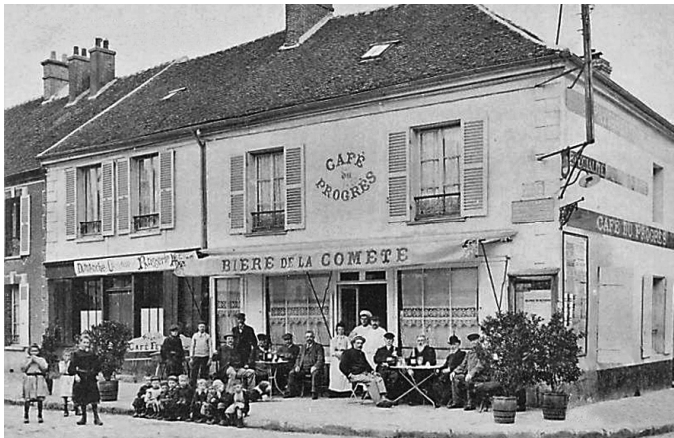
Au n°1 de la place Carte postale ancienne - début du XX ème siècle

Au même endroit, au n°1 de la place Photo : B. Chigot Association "Regard en Coin" - 2023