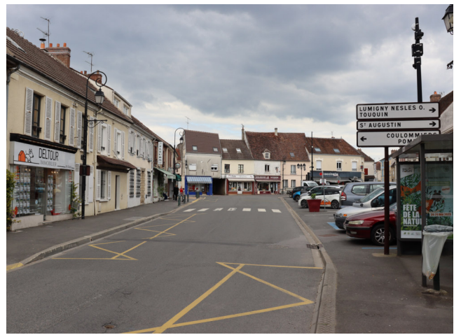
Au même endroit, place de Gaulle vue vers la rue des Moutiers Photo : B. Chigot - 2023 - Association "Regard en Coin"