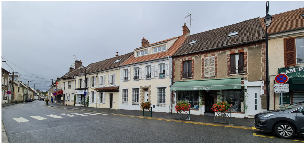
Vue sur place du général de Gaulle vers la rue des Ormes