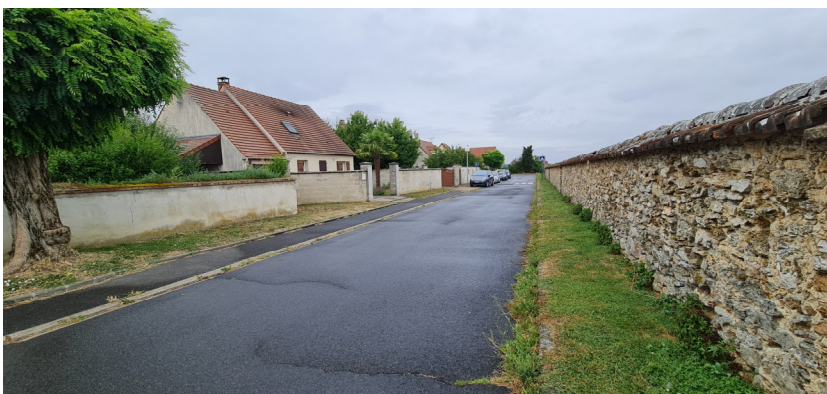
Extrémité de la rue Le cimetière est à droite Photo : I. Aubertin - 2023