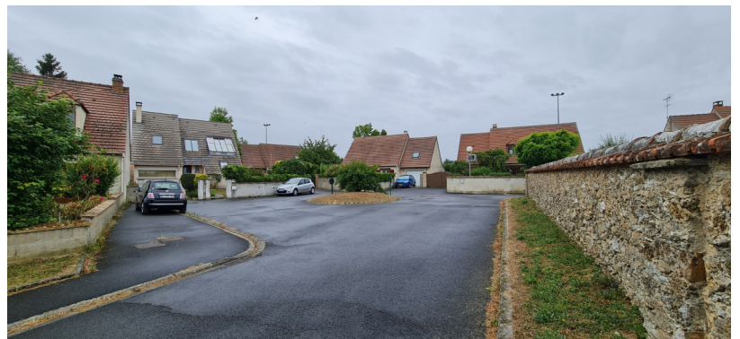
Espace de demi-tour au milieu de la rue Le cimetière est à droite