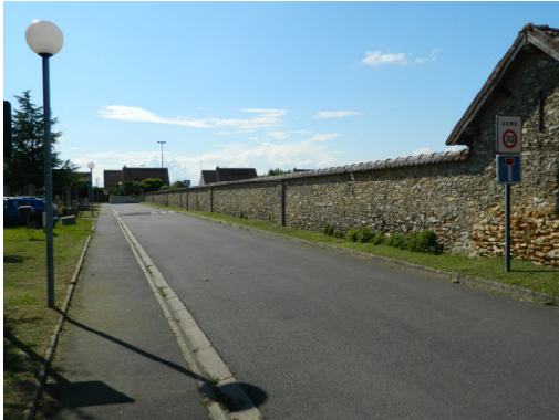
Entrée de la rue vue depuis le boulevard Paul Niclausse Le cimetière est à droite