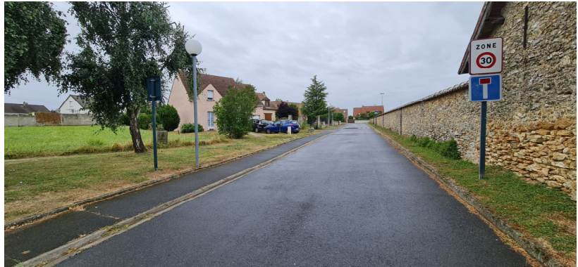
Entrée de la rue vue depuis le boulevard Paul Niclausse - 2023