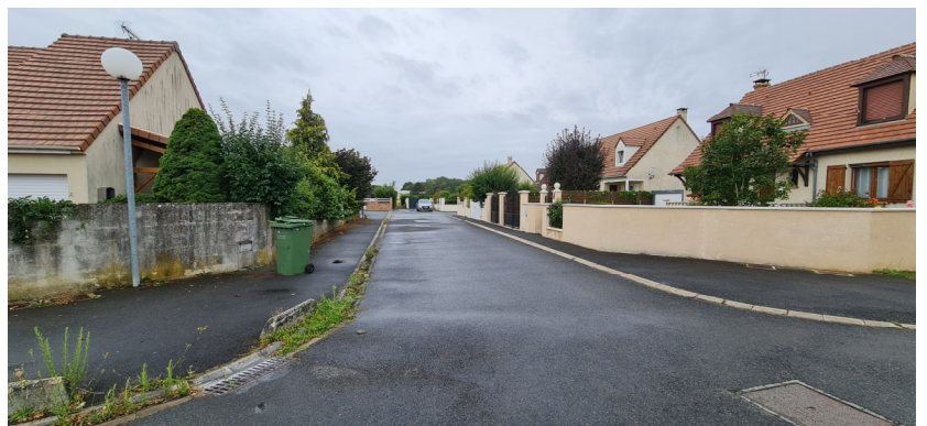
Rue vue depuis l'extrémité en impasse