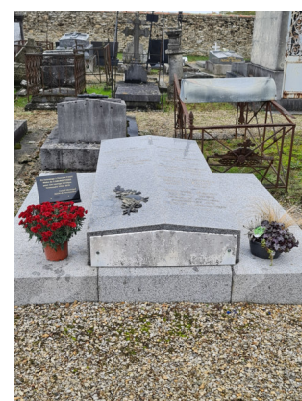
Tombe de Narcisse Fahy dans le cimetière de Faremoutiers Photo : I. Aubertin - 2020

Depuis le centenaire de la fin de la 1 ère guerre mondiale, le conseil municipal a décidé de lui rendre hommage en déposant une gerbe sur sa tombe le 11 novembre de chaque année.