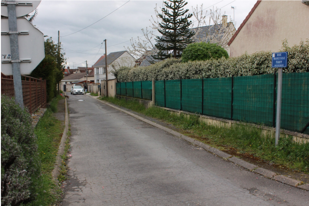
Rue Narcisse Fahy - 2023