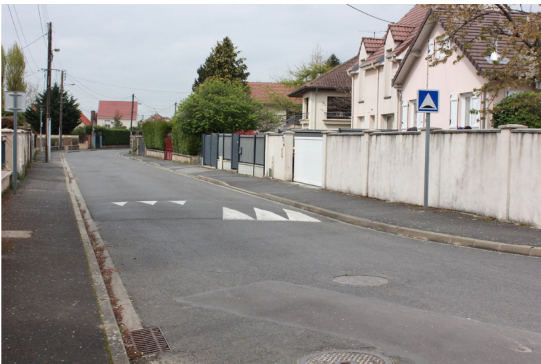
Boulevard Louis Durand Photo : N. Lucas - Association "Regard en coin" - 2023