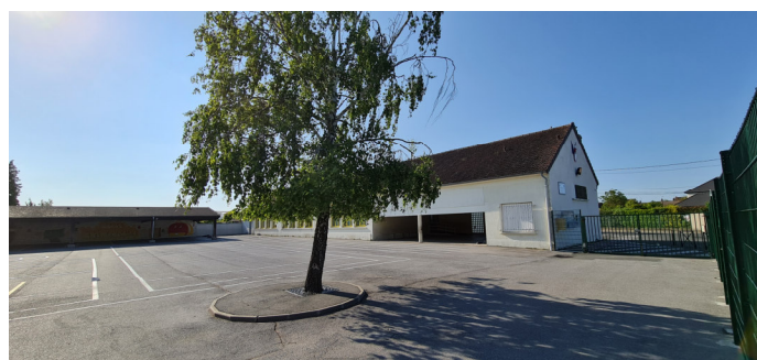
Groupe Scolaire "Simone Veil" - Vue sur l'école primaire, ex-collège d'enseignement général Photo : I. Aubertin - 2023