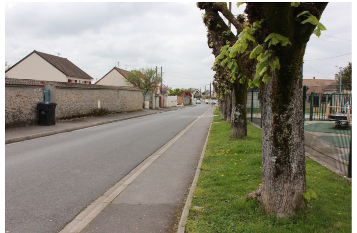
Boulevard Louis Durand Photo : N. Lucas Association "Regard en coin" - 2023