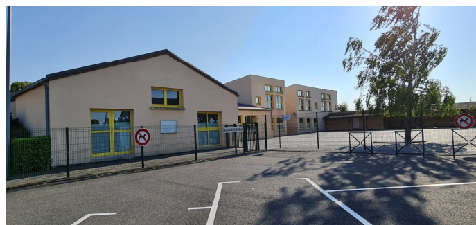
Groupe Scolaire "Simone Veil" - Vue sur l'école maternelle (au premier plan) et l'école primaire (au second plan) Photo : I. Aubertin - 2023