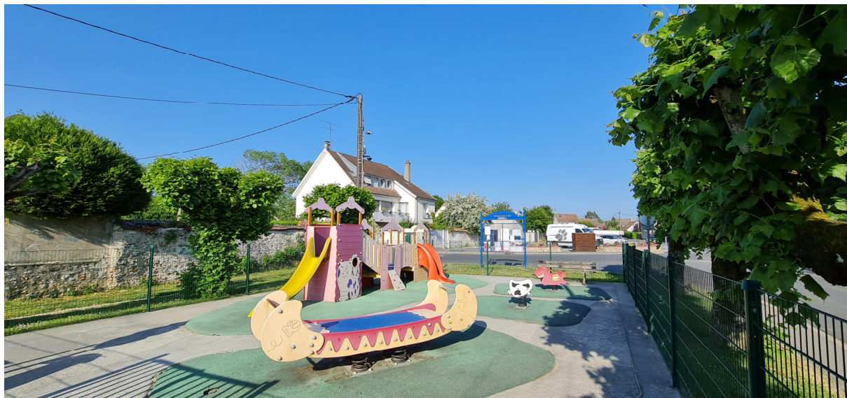
Aire de jeux Photo : I. Aubertin - 2023

L'aire de jeux comprend 4 installations : un château-toboggan, un bateau et 2 bascules en forme de vache et poney. Il a été ouvert en 2008 (1) pour permettre aux plus jeunes de pouvoir s'amuser lors de promenades ou après la classe.