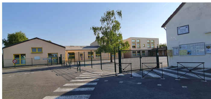
Groupe Scolaire "Simone Veil" - Vue sur l'école maternelle (bâtiment à gauche) et l'école primaire (dans la cour)