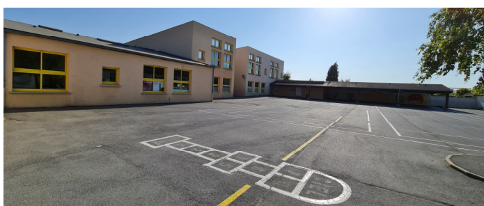
Groupe Scolaire "Simone Veil" - Vue sur l'école primaire, la cour et le préau Photo : I. Aubertin - 2023