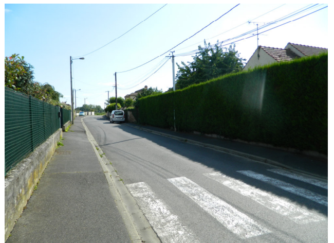
Rue d'Hautefeuille Photo : B. Chigot - Association "Regard en coin" - 2023