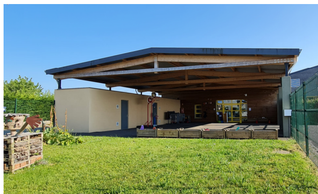
Centre de loisirs - Vue du parvis de l'entrée principale Photo : I. Aubertin - 2023