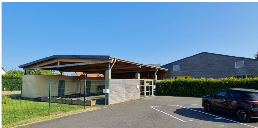
Centre de loisirs - Vue de l'entrée principale

Sa gestion sera transférée par la suite à la Communauté de Communes de la Brie des Moulins devenue la Communauté d'Agglomération Coulommiers Pays de Brie.