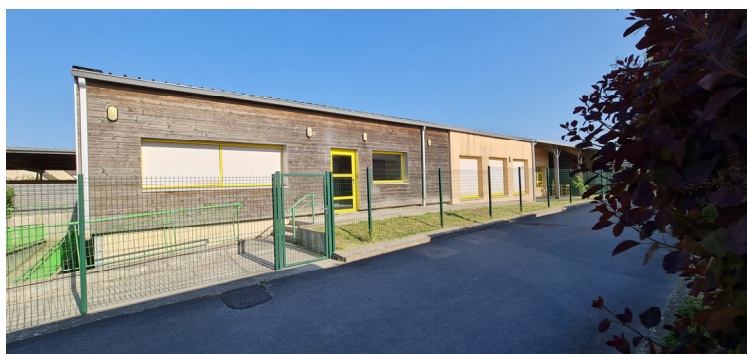
Centre de loisirs - Vue des bâtiments