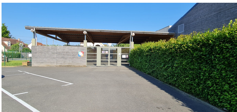
Centre de loisirs - Vue de l'entrée principale Photo : I. Aubertin - 2023