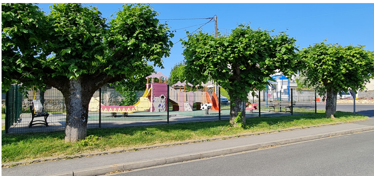
Aire de jeux - Vue du boulevard Louis Durand Photo : I. Aubertin - 2023