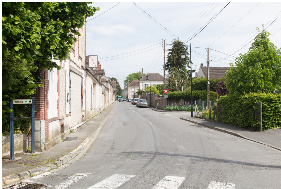
Photo 1 : Carte postale ancienne - début XX ème siècle Photo 2 : B. Chigot - Association "Regard en Coin" - 2023