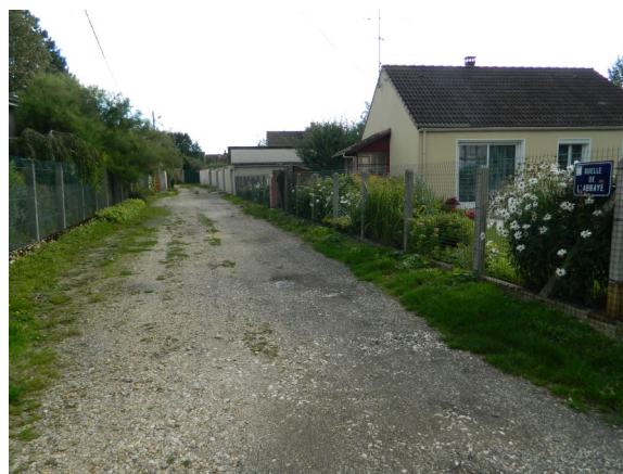
Ruelle de l'abbaye Photo : B. Chigot Association "Regard en Coin" - 2023