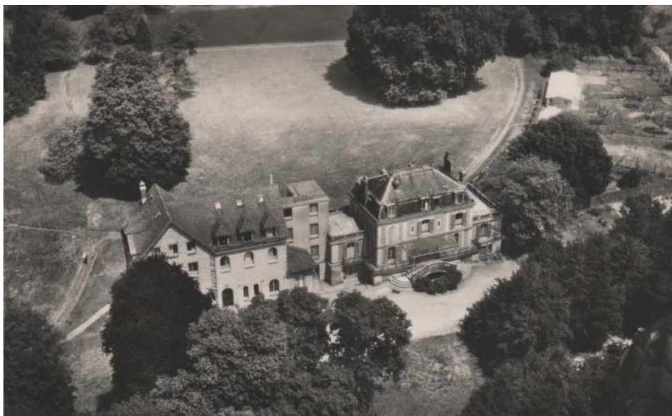
Abbaye—Vue aérienne : à gauche, bâtiment EHPAD, et à droite, maison bourgeoise du XIX ème siècle

L'abbaye possède aujourd'hui une boutique d'articles artisanaux ainsi qu'un parc remarquable en partie accessible au public aux horaires de la boutique.