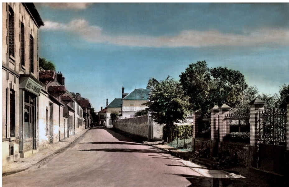
Jonction entre la rue Foch et la rue Fénelon Desfourneaux : Hôtel des voyageurs à gauche et école des filles (aujourd'hui Maison Médicale) à droite

Photo 1 : Carte postale ancienne - début XX ème siècle Photo 2 : B. Chigot - Association "Regard en Coin" - 2023