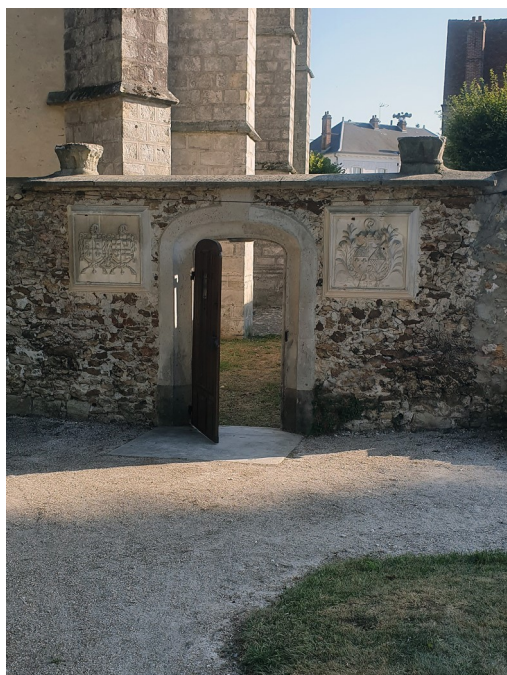
Porte des Pauvres, vue depuis l'abbaye Photo prise en 2019 - I. Aubertin, retouchée par M. De Boissy