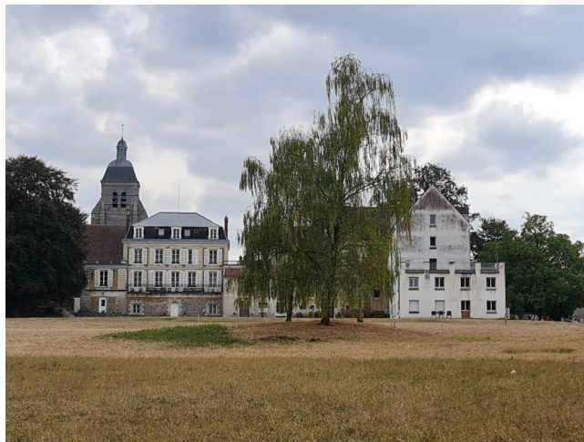
Abbaye vue du parc

Monastère fondé par Sainte Fare, 1 ère abbesse de Faremoutiers, autour de l'an 620. Ce monastère fut établi sur le lieu-dit des "terres d'Eboriac". Cette abbaye fut, dès le VII ème siècle, un monastère double, le premier en France à accueillir des moines et des moniales. Les religieuses étaient issues de familles nobles.