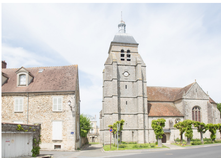
Porte des Pauvres, au centre, au bout de l'allée entre la maison et l'église