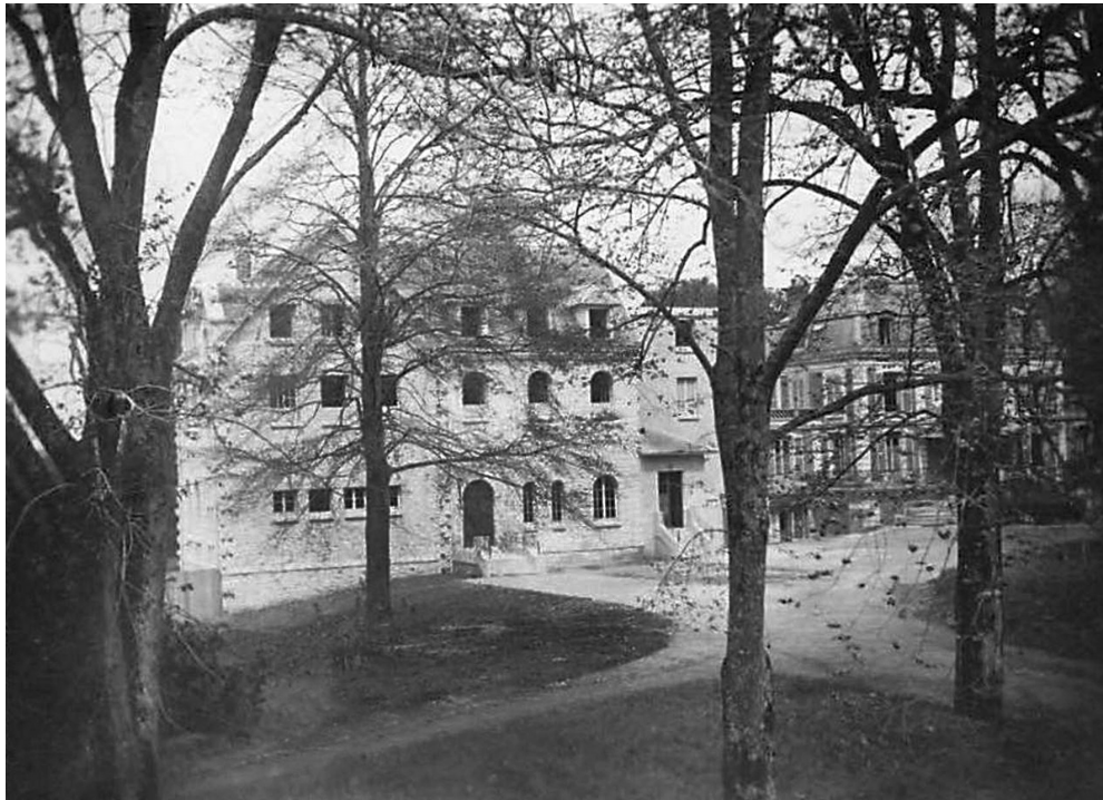
Bâtiments abbatiaux en construction dans les années 1930 Carte postale ancienne