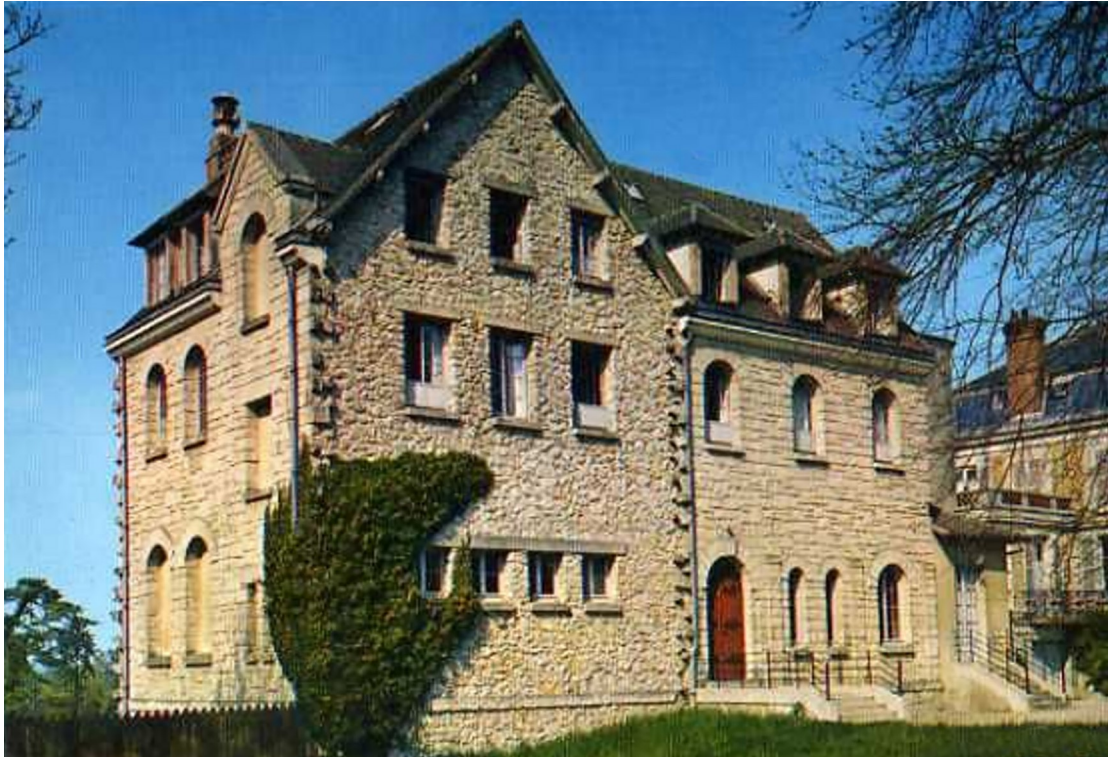
Bâtiments abbatiaux construction achevée dans les années 1930 Carte postale ancienne