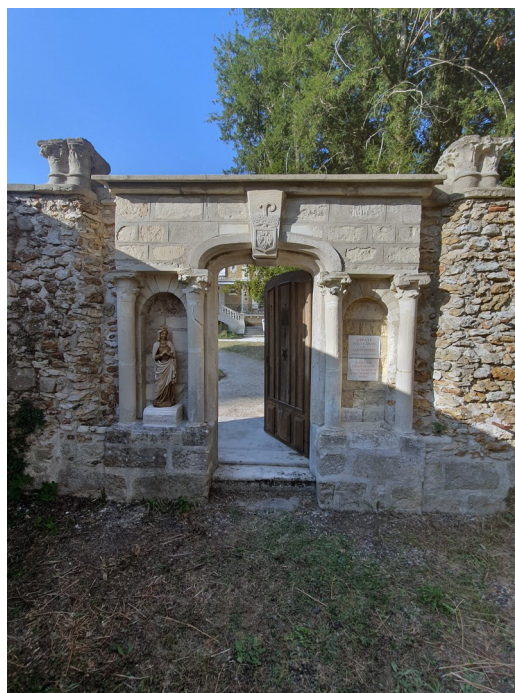
Porte des Pauvres, vue depuis la rue