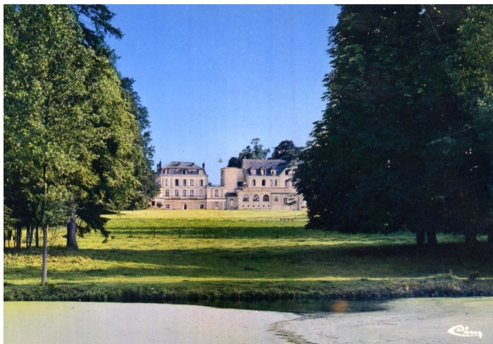
Abbaye vue du parc Carte postale ancienne - années 1970