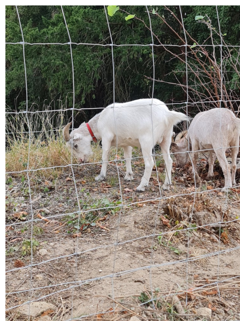
Abbaye - Vue du parc et de la maison bourgeoise. Des vaches au début du XX ème siècle, et des chèvres sur les ruines de l'église abbatiale en 2019